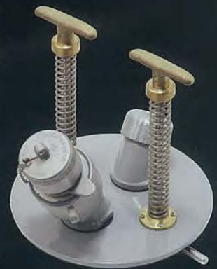
リカバリーハッチジョイント

ECO通気口※(圧力弁付通気口)を併設することにより、荷卸し時以外の通常時における大気中のペーパー拡散が防止され、欠減抑制はもとより環境汚染対策等にさらなる効果を発揮します。