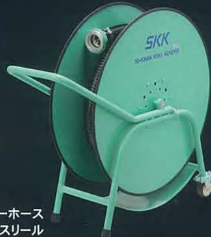
ペーパーリカバリーホース 収納用ホースリール

作業効率が上がリ作業時間を大幅に短縮させる専用のタワー式ペーパーリカバリーホースおよびペーパーリカバリーホース収納用ホースリールを取り揃えておりますので、最寄りの支店・営業所へお問い合わせください。